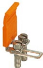
Коммутационные переключатели, Полюсов: 2, Цвет: серебристый

Обратите внимание на то, что приведенные здесь данные взяты из online-каталога. Полная информация и данные содержатся в документации пользователя. Действуют Общие условия использования для информации, загруженной из интернета. ( http://phoenixcontact.ru/download )