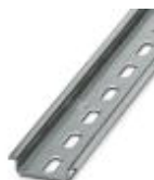
DIN-рейка, материал: оцинкованный, с отверстиями, высота 7,5 мм, ширина 35 мм, длина: 2 м

DIN-рейка, с перфорацией - NS 35/ 7,5 ZN PERF 2000MM - 1206421