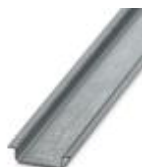
DIN-рейка, материал: оцинкованный, без отверстий, высота 7,5 мм, ширина 35 мм, длина: 2 м

Несущая рейка без перфорации - NS 35/ 7,5 ZN UNPERF 2000MM - 1206434