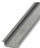
Несущая рейка без перфорации, Ширина: 35 мм, Высота: 7,5 мм, Длина: 2000 мм, Цвет: серебристый

Несущая рейка без перфорации - NS 35/ 7,5 AL UNPERF 2000MM - 0801704