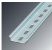
Профиль DIN-рейки 35 мм (NS 35)

DIN-рейка, с перфорацией - NS 35/ 7,5 WH PERF 2000MM - 1204119