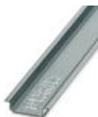
Профиль DIN-рейки 35 мм (NS 35)

Монтажная рейка - NS 35/ 7,5 WH UNPERF 2000MM - 1204122