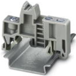
Концевой стопор, Ширина: 9,5 мм, Высота: 35,3 мм, Длина: 50,5 мм, Цвет: серый

Обратите внимание на то, что приведенные здесь данные взяты из online-каталога. Полная информация и данные содержатся в документации пользователя. Действуют Общие условия использования для информации, загруженной из интернета. ( http://phoenixcontact.ru/download )