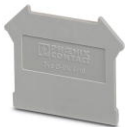
Концевая крышка, Длина: 42,5 мм, Ширина: 1,8 мм, Высота: 35,9 мм, Цвет: серый

Обратите внимание на то, что приведенные здесь данные взяты из online-каталога. Полная информация и данные содержатся в документации пользователя. Действуют Общие условия использования для информации, загруженной из интернета. ( http://phoenixcontact.ru/download )