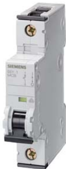
CIRCUIT BREAKER 230/400V 6KA, 1-POLE, C, 16A, D=70MM