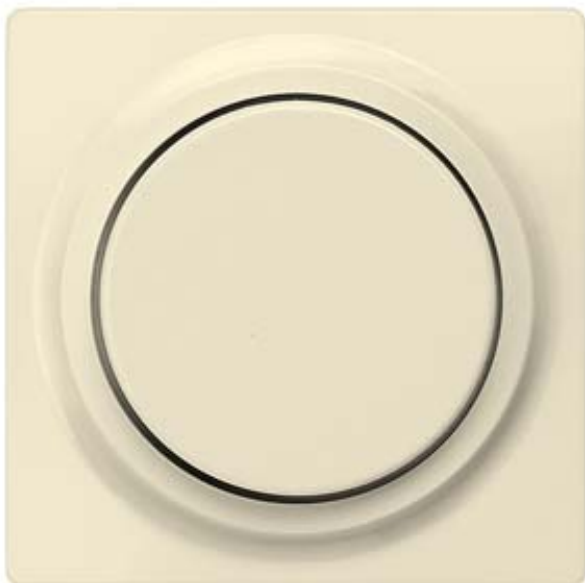
I-SYSTEM, ELECTRIC WHITE COVER PLATE F. DIMMER W. ROTARY BUTTON 55X55MM