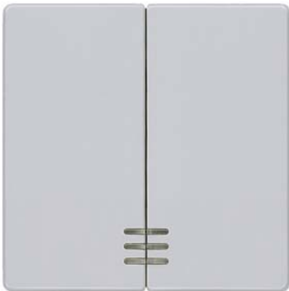
I-SYSTEM, ALUMIN.METALLIC ROCKER W. WINDOW F.2- CIRCUIT/DUAL 2-WAY SWITCH 55X55MM