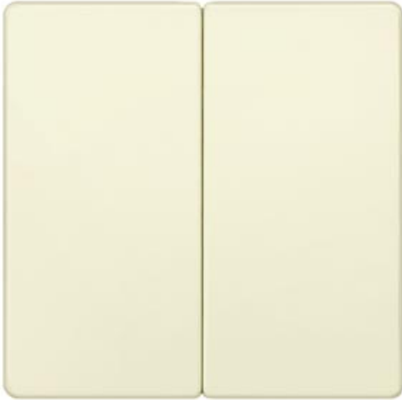
I-SYSTEM, ELECTRIC WHITE ROCKER F.2-CIRCUIT/DUAL 2-WAY SWITCH F. DOUBLE PUSHB., 55X55MM