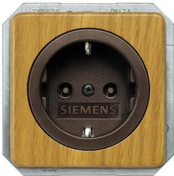
DELTA NATUR, LIGHT OAK SCHUKO SOCKET OUTL. 10/16A 250V W. SCREWLESS TERMINALS COVER PLATE 62X62MM