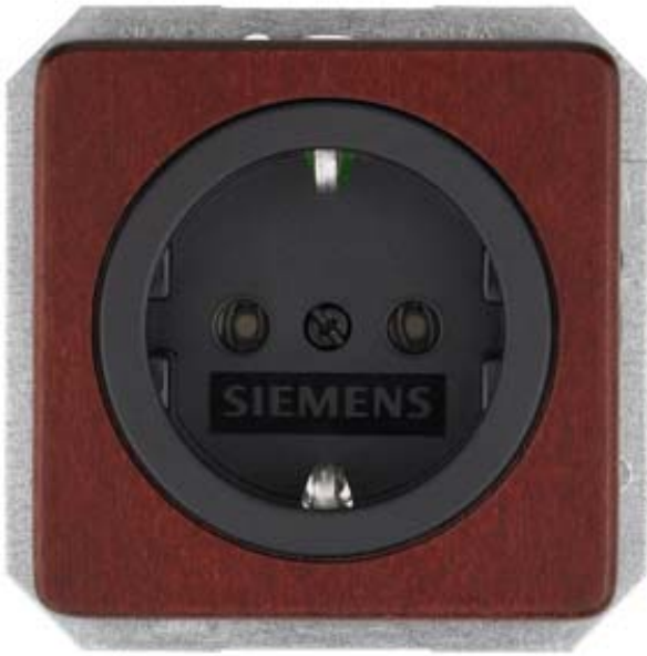
DELTA NATUR, RED MAPLE SCHUKO SOCKET OUTL. 10/16A 250V W. SCREWLESS TERMINALS COVER PLATE 62X62MM