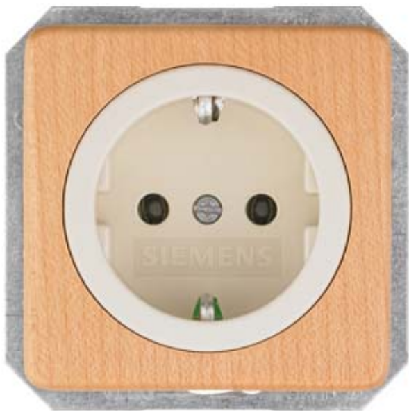
DELTA NATUR, BEECH SCHUKO SOCKET OUTL. 10/16A 250V W. SCREWLESS TERMINALS COVER PLATE 62X62MM