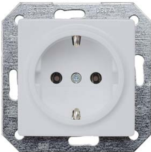
I-SYSTEM, ALUMIN.METALLIC SCHUKO SOCKET OUTL. 10/16A 250V W. SCREWLESS TERMINALS COVER PLATE 55X55M