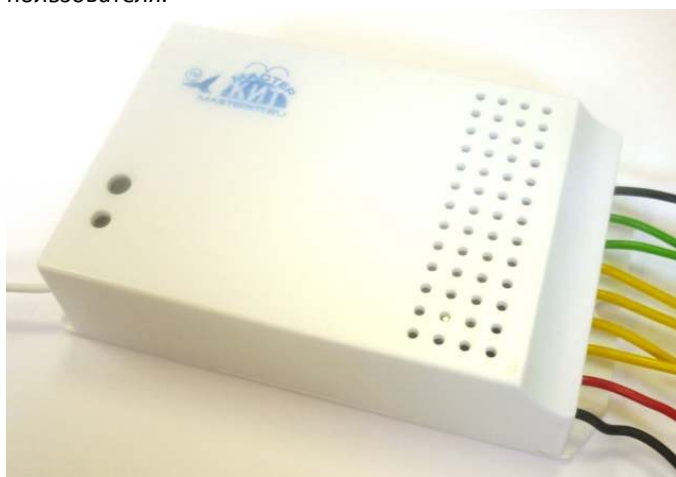
Рис. 1 Внешний вид

Устройство представляет собой двухканальное реле и предназначено для коммутации нагрузки по радиоканалу частотой 433,92 МГц. Важной особенностью MP330 является обратная связь с устройством управления. Благодаря этому известно, выполнена команда или нет, если объект управления находится вне зоны видимости пользователя.