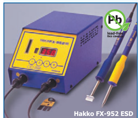
Hakko FX-952 ESD