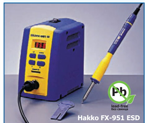
Hakko FX-951 ESD