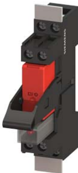
PLUG-IN RELAY COMPACT UNIT DC 24V, 2 CO CONTACT LED MODULE RED STANDARD PLUG-IN SOCKET SCREW TERMINAL