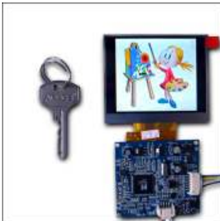
Рис.1. Внешний вид модуля

С помощью кнопок на плате управления можно настроить насыщенность, яркость и контрастность. А также включить или выключить.