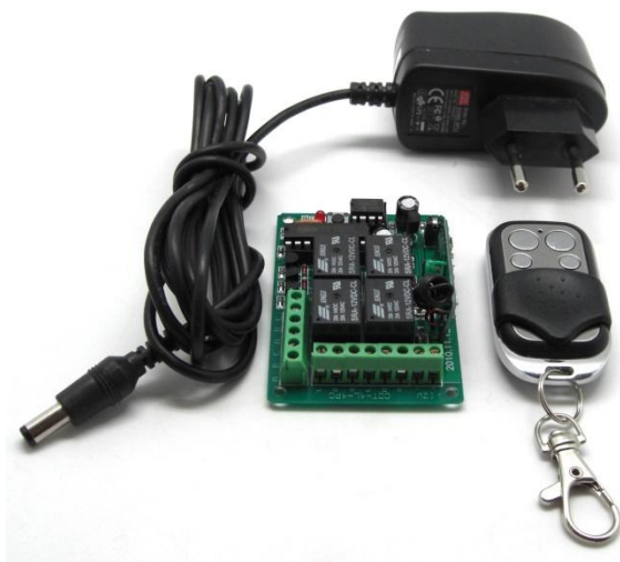
Рис.1 Общий вид устройства.

DIY-комплект для дистанционного управления различным электрооборудованием с помощью брелка-передатчика на радиочастоте 433 МГц по 4-м независимым каналам, с помощью электромагнитных реле.