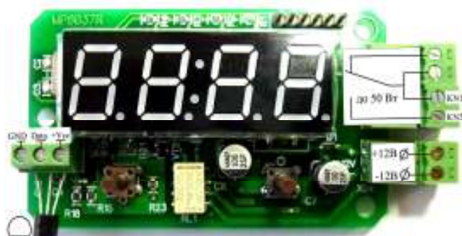
Рис. 2 Назначение разъемов.

что приводит к завышенным показаниям. Поэтому для точных показаний термостата, необходимо вынести термодатчик за пределы корпуса устройства.