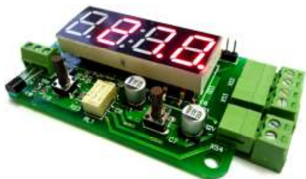
Рис. 1 Общий вид устройства.

Предлагаемый блок в собранном виде позволяет реализовать принцип: купил – подключил. Блок позволит радиолюбителю получить простой и надежный цифровой термостат с возможностью измерения и контроля температуры в диапазоне -55°С до +125°С. Устройство будет полезно для применения в быту, дома, на даче, бане или погребе. С его помощью можно производить измерения температуры окружающей среды, контролировать и регулировать рабочую температуру электрических котлов, теплого пола, теплиц, холодильных установок или морозильных камер. Устройство запоминает настройки гистерезиса при отключении питания.