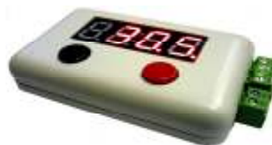
Рис. 4 Вариант оформления устройства.

Подключение реле TR91F-220VAC-SC-A на 220В, для управления мощной нагрузкой до 8 кВт (реле приобретается отдельно)