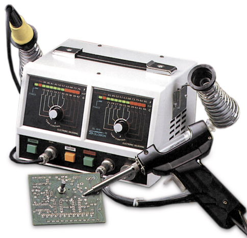
Нагревательные элементы для станции SL-916