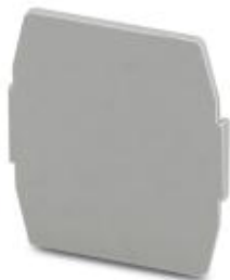
Разделительная пластина, Длина: 22 мм, Ширина: 0,5 мм, Высота: 22 мм, Цвет: серый

Обратите внимание на то, что приведенные здесь данные взяты из online-каталога. Полная информация и данные содержатся в документации пользователя. Действуют Общие условия использования для информации, загруженной из интернета. ( http://phoenixcontact.ru/download )