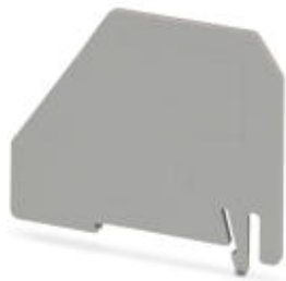
Разделительная пластина, Длина: 65,3 мм, Ширина: 2 мм, Высота: 60 мм, Цвет: серый

Обратите внимание на то, что приведенные здесь данные взяты из online-каталога. Полная информация и данные содержатся в документации пользователя. Действуют Общие условия использования для информации, загруженной из интернета. ( http://phoenixcontact.ru/download )