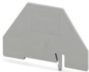
Разделительная пластина, Длина: 83 мм, Ширина: 2 мм, Высота: 60 мм, Цвет: серый

Обратите внимание на то, что приведенные здесь данные взяты из online-каталога. Полная информация и данные содержатся в документации пользователя. Действуют Общие условия использования для информации, загруженной из интернета. ( http://phoenixcontact.ru/download )