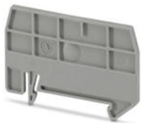
Разделительная пластина, Длина: 59,8 мм, Ширина: 2 мм, Высота: 39 мм, Цвет: серый

Обратите внимание на то, что приведенные здесь данные взяты из online-каталога. Полная информация и данные содержатся в документации пользователя. Действуют Общие условия использования для информации, загруженной из интернета. ( http://phoenixcontact.ru/download )