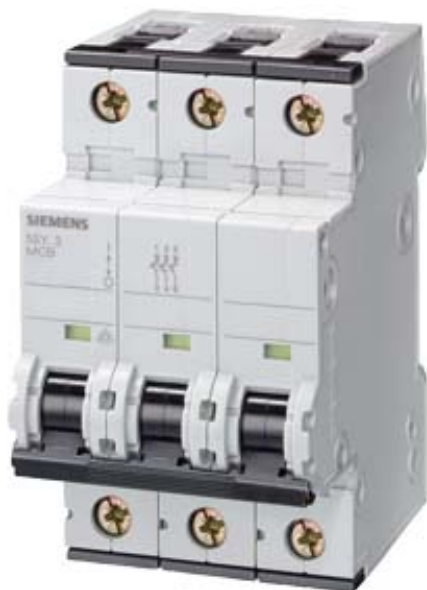
CIRCUIT BREAKER 400V 6KA, 3-POLE, C, 40A, D=70MM