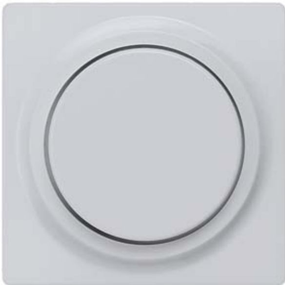
I-SYSTEM, ALUMIN.METALLIC COVER PLATE F. DIMMER W. ROTARY BUTTON 55X55MM