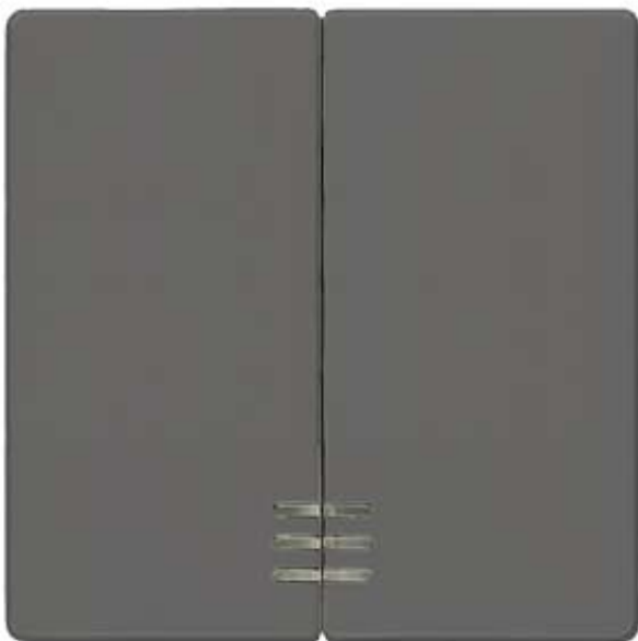
I-SYSTEM, CARBON METALLIC ROCKER W. WINDOW F.2- CIRCUIT/DUAL 2-WAY SWITCH 55X55MM