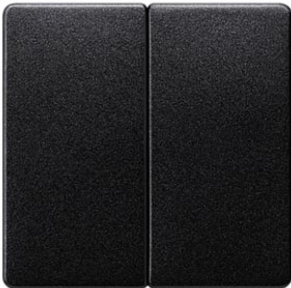
I-SYSTEM, CARBON METALLIC ROCKER F.2-CIRCUIT/DUAL 2-WAY SWITCH F. DOUBLE PUSHB., 55X55MM