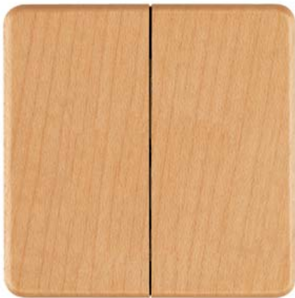
DELTA NATUR, BEECH ROCKER F.2-CIRCUIT/DUAL 2-WAY SWITCH F. DOUBLE PUSHB., 62X62MM