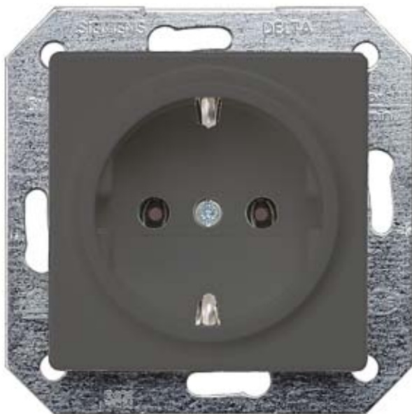
I-SYSTEM, CARBON METALLIC SCHUKO SOCKET OUTL. 10/16A 250V W. SCREWLESS TERMINALS COVER PLATE 55X55M