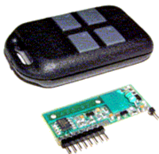
Рис.1 Общий вид приемника и передатчика

Устройство дистанционного управления представляет собой комплект из четырехкнопочного передатчика, сделанного в виде брелока, и приемника, в виде платы размером 40x15 мм, имеющего логические выходы. Каждый выход приемника управляется соответствующей кнопкой на пульте передатчика, при этом на выходах приемника формируются уровни логической единицы. Передача команд осуществляется по радиоканалу на частоте 433 МГц широтно-импульсной модуляцией. Каждый пульт и приемник имеет свой персональный (прошитый) код, поэтому какие-либо совпадения между комплектами исключены.