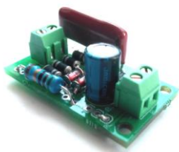
Общий вид устройства. Рис.1

Данный модуль разработан специально для устройств из каталога мастер кит VM8039, VM8039D и VM8036. Но с успехом может использоваться с любой домашней автоматикой и сигнализацией. Устройство имеет опто-гальваническую развязку, это дает возможность подключать модуль непосредственно к выводу микроконтроллера. Модуль будет полезен для проектов пользователей на базе микроконтроллеров и плат Arduino и Raspberry.