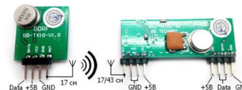
Рис.2 Схема подключения

В качестве антенны, для дальности до 600 м, используйте отрезки монтажного провода длиной 17 см. При дистанции более 600 метров необходимо использовать направленные антенны.