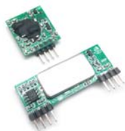
Рис.1 Общий вид

Набор беспроводного приемника и передатчика диапазона 433 МГц. Предназначен для построения беспроводных систем на базе микроконтроллера Arduino и Raspberry. И будет полезен для проектов управления авио и авто моделями. А также проектов охраны и автоматике, для построения беспроводных датчиков и исполнительных реле, дистанционного управления электроприборами до 600 метров. Будет незаменим для увеличения дальности и надежности работы уже существующих ДУ розеток и систем беспроводного управления диапазона 433 МГц, таких как WOKEE, TELEIMPEX и т.п.