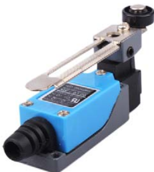
Общий вид устройства

Выключатель предназначен для ограничения рабочего движения и отключения рабочего механизма ворот, дверей, окна, форточки, подъемника. Будет незаменим при проектировании автоматического открывания ворот, вентиляции в доме или теплицы, электрической лебедки или подъемника и т.п. Данный переключатель имеет пыле и влагозащищенный корпус, что позволяет применять его не только в доме но и в различных отраслях промышленности.