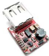
Общий вид устройства. Рис.1

Модуль представляет собой повышающий DC/DC преобразователь напряжения. Преобразователь будет полезен для питания электронных устройств, планшетов, смартфонов, телефонов и т.п. устройств от аккумуляторной батареи напряжением 3,7В. Будет незаменим для самодельной реализации Power Bank.